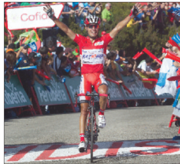
Déjà vainqueur la veille, le leader de la Vuelta Joaquim Rodriguez a récidivé hier lors de la 1 re des 3 grosses étapes de montagne et se pose définitivement en favori crédible à la victoire finale.